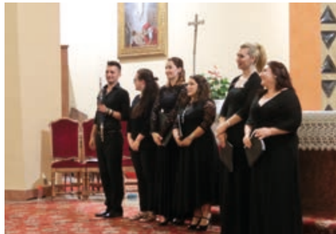
Il concerto dell'ensemble AmicAntica