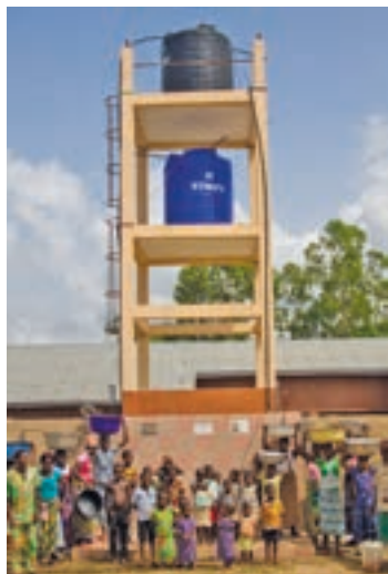
Il forage con torre piezometrica costruito ad Agonve Hweli

A lcuni guasti ai macchinari hanno leggermente ritardato i lavori di realizzazione delle perforazioni per l'acqua potabile programmate dal GMM per il 2017 in Benin. Le nuove fonti d'acqua sono comunque pronte e disponibili per la popolazione dall'inizio della scorsa estate. Le perforazioni ("forage"), tutte dotate di torri piezometriche ed impianti fotovoltaici per alimentare le pompe idrauliche, sono state