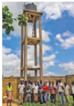
Pazienti ed operatori dell'"Oasis d'Amour" di Tokplie davanti alla nuova torre