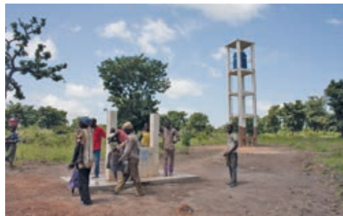
Eine Bohrung des GMM in Tenonrou

Für die Verwirklichung der oben genannten vier Wasserstellen haben die Rotary Clubs 105.668.- USD gesammelt. Die Aktion ist Teil der zahlreichen Initiativen, mit denen das hundertjährige Bestehen der Rotary Foundation gewürdigt wird. Sie hat in den letzten hundert Jahren neben zahllosen anderen Hilfsaktionen in Zusammenarbeit mit der Bill & Melinda Gates Foundation drei Milliarden USD zur Verfügung gestellt, um die Kinderlähmung auszurotten.