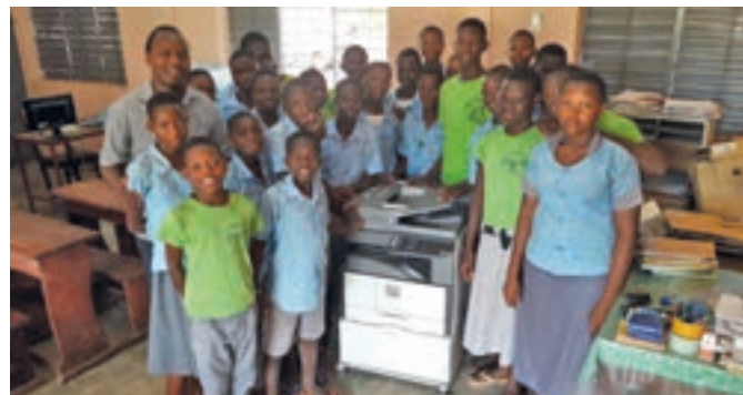
La fotocopiatrice donata alla biblioteca "Emanuele Combi"

FOTOCOPIE A KOUANDE. Alla biblioteca "Emanuele Combi" di Kouande è arrivata la fotocopiatrice. L'apparecchio è stato acquistato grazie ai fondi raccolti con