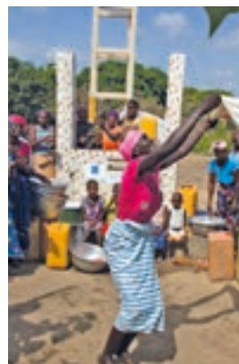
Il pozzo nel villaggio di Monroussari Souakpa

L'appuntamento è anche un'occasione per far conoscere i progetti realizzati dal GMM negli ultimi anni in Africa Occidentale. A questo scopo, nell'atrio di Terme Merano, sono stati allestiti una mostra fotografica ed un infopoint oltre ad un'esposizione di artigianato del Benin e del Burkina Faso. I fondi raccolti nell'edizione 2017 della gior-