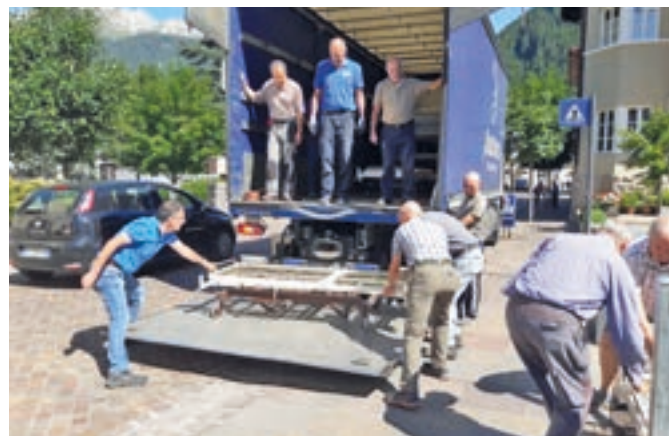
Il carico dei materiali donati dalla Casa "San Gaetano"

l'altro, venti letti di tipo ospedaliero con materassi, due sterilizzatrici, due sedie a rotelle, bastoni da passeggio ed ausili ortopedici. Un grazie di cuore alla Casa di riposo ed ai volontari delle Acli di Predazzo, ed in particolare al loro presidente, signor Livio Morandini, che hanno aiutato a caricare sul camion i materiali donati per la spedizione a Merano.