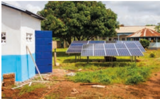
I pannelli dell'impianto fotovoltaico

Grazie all'aiuto di un padre Comboniano raddomante che con il suo rametto riesce ad individuare una vena d'acqua, si comincia a scavare (a mano!) un pozzo. I giorni, però, passano uno dopo l'altro senza successo, ma, quando ormai le speranze vengono meno, a 37