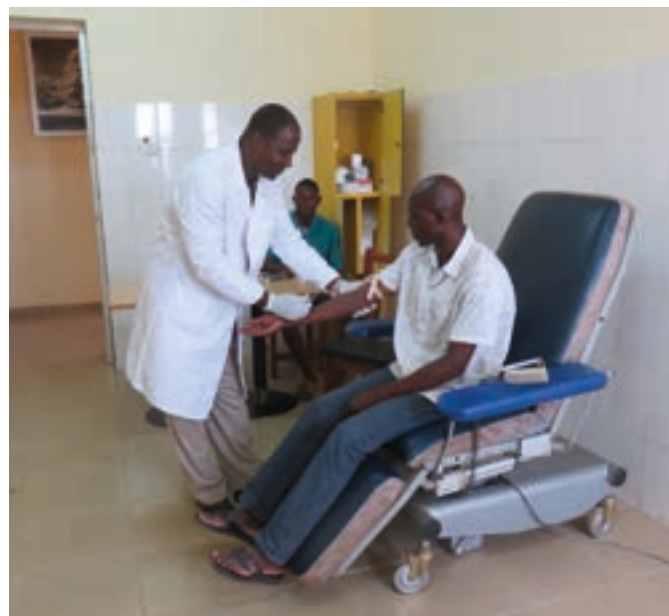
Prelievi al dispensario Paligwend