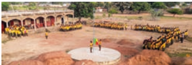
Gli studenti del centro scolastico "Maria Adelaide" di Bembereke

Grazie ad un contributo della Cei, il GMM negli ultimi anni ha realizzato in Benin anche la sede dell'Istituto di studi per la formazione di educatori specializzati (Isfes) a Cotonou, il dispensario medico "Adriana Del Prato" sull'isola di Agonve e la scuola secondaria "Jean Louis Brehier" a Kouande.