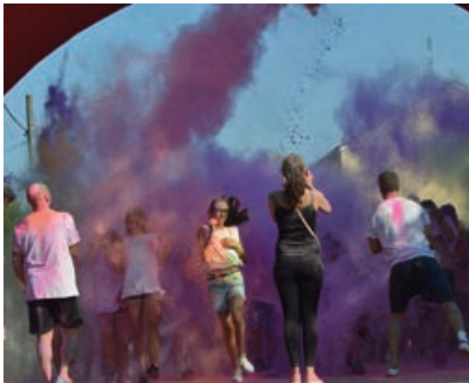
La color run di Vermezzo

G rande successo e tanta partecipazione di giovani e persone di ogni età alla seconda edizione di "Corriamo per Emanuele", la "color run" organizzata lo scorso mese di giugno dal Comune di Vermezzo (Mi) in memoria di