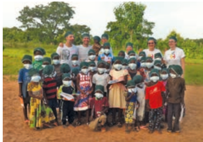
Lo staff della missione di Cute Project con i bambini del laboratorio didattico

Operati 70 pazienti in 7 giorni di sala operatoria, più di 150 visite specialistiche effettuate, preparati e confezionati 50 indumenti elasto-compressivi e 18 splint funzionali per la cura degli esiti cicatriziali da ustione: questi sono i numeri della spedizione supportata come di consueto dal GMM sia per l'organizzazione che per la preparazione della missione. Obiettivo ultimo? Realizzare all'ospedale "St. Padre Pio" di N'Dali un punto di riferimento stabile per la popolazione del Benin specializzato nella cura delle patologie cutanee.