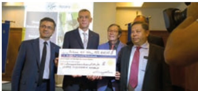
I presidenti dei Rotary Club altoatesini con il presidente del GMM

diocesana ed il Rotary Club di Parakou. Per la costruzione dei quattro "forage" i Rotary Club hanno raccolto e messo a disposizione 105.668 dollari. Il progetto s'inquadra nelle numerose attività svolte in occasione del centenario della Rotary Foundation, che durante gli ultimi 100 anni, tra le molte operazioni di sostegno e solidarietà, ha speso 3 miliardi di dollari per debellare la polio, supportata dalla Bill & Melinda Gates Foundation.