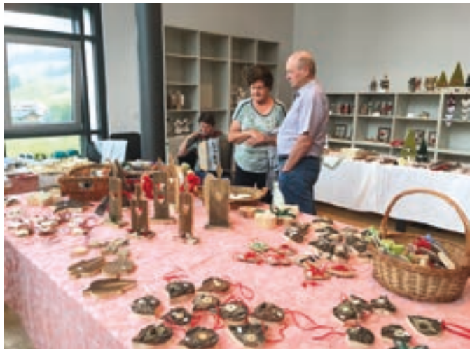
Il mercatino del Kvw di La Villa in Val Badia

GMM in Africa, nel campo dell'igiene, dell'educazione e della salute. Dal GMM un grazie di cuore agli amici di La Villa ed in particolare al dott. Lois Castlunger per il loro sostegno.