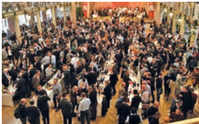
Il Merano Winefestival

Le degustazioni guidate sono state organizzate dal Merano Winefestival in collaborazione con: Sassicaia (Bolgheri), Consorzio Tutela Vini Sannio (Benevento), Ceretto