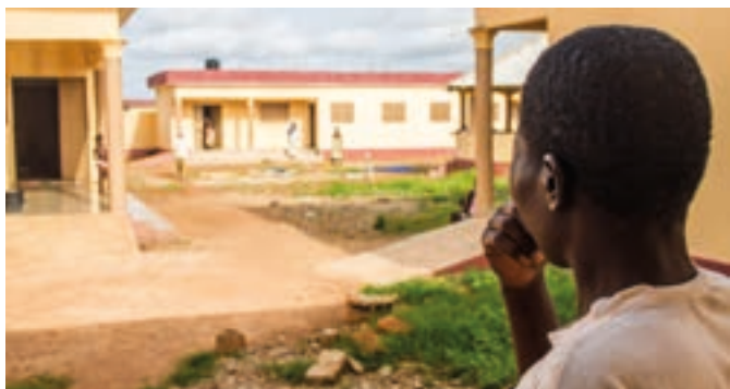
Una paziente del Centro di Zooti

A vvziata da pochi mesi l'attività di assistenza, al centro di salute mentale "Misericordia - Oasis d'Amour", di Zooti, in Togo, si continua a lavorare per mettere a punto la struttura in modo da consentire un'accoglienza dignitosa dei pazienti. Il prossimo passo sarà la costruzione di impianti che garantiscano la fornitura di energia elettrica al centro.