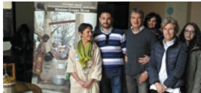
A Bassano in ricordo di un grande amico dell'Africa

Un grazie anche agli sponsor che hanno contribuito economicamente oppure con l'offerta dei loro prodotti: Seitron Spa, Contrà del Sole, Pasticceria Milano, Grappa Poli, Azienda Valsugana, Città del Sole, GS Colori di Cittadella.