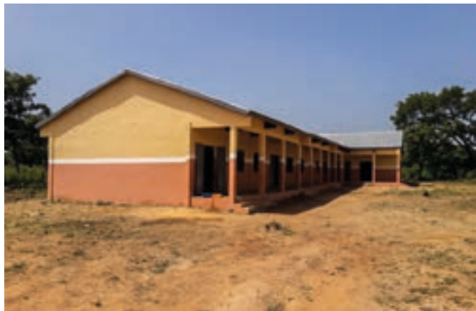
Il secondo modulo della scuola di Gougnenou

ta. Quest'anno, sempre con un contributo della Regione Trentino Alto Adige, è stato finalmente possibile costruire anche la seconda parte della struttura che comprende tre nuove aule ed una sala polivalente.