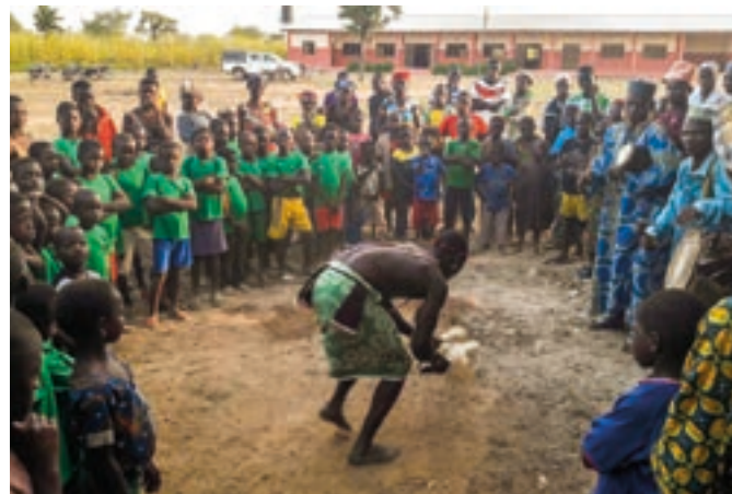
Festa a Yakabissi per il completamento della scuola "Maria Cristina Santuari"

È stato completato il secondo modulo della scuola primaria "Maria Cristina Santuari" a Yakabissi, villaggio del comune di Birni, nel dipartimento dell'Atacora (Nord Benin). Il primo edificio dell'istituto scolastico intitolato all'insegnante e dirigente scolastica dell'Istituto Marcelline di Bolzano scomparsa nel 2014, comprendente le prime tre aule, la direzione ed i servizi igienici, era stato inaugurato lo scorso anno, a fine ottobre.