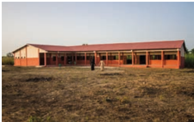
Das neue Gebäude der Grundschule „Maria Cristina Santuari“ von Yakabissi